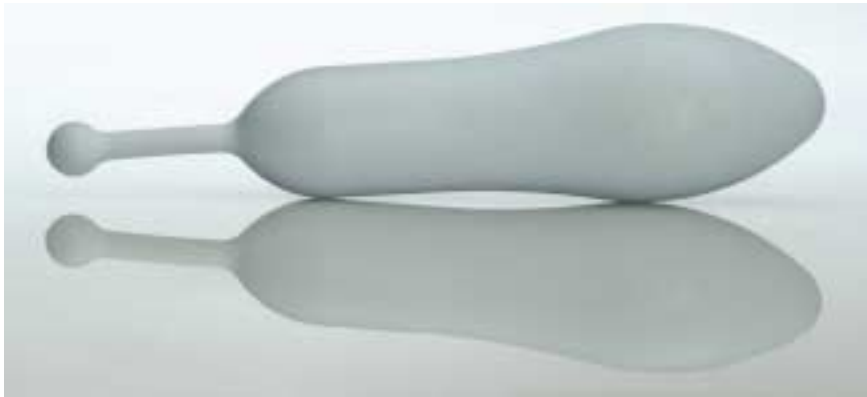
Abbildung 3: Vaginale Bettflasche Vagitherm®

Wärme direkt und intensiver die Harnröhre und auch das Trigonum der Blase erreichen. Diese Wärmeanwendungen sind noch wenig bekannt.